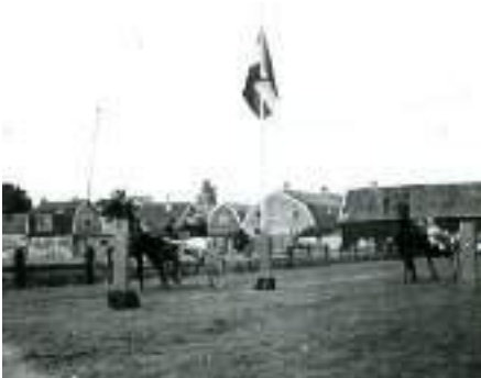
De nieuwe startinstallatie in Lisse (1935)

In 1927 komt er een nieuwigheid. Voor communicatie tussen start en finish wordt een veldtelefoon geïntroduceerd. Nu hoeven de ingehuurde snelle schooljongens niet meer met berichten tussen start en finish op en neer te rennen. Radio Ferrée introduceerde in 1933 geluid op de baan, dat was een flinke verbetering. Toeschouwers konden zo op de hoogte gebracht worden van de rituitslag. Ferrée ontwikkelde een startinstallatie met daaraan gekoppeld twee elastieken, één voor elke baan. Als de paarden in het startvak stonden, drukte de starter de startplaat in. Bij 1-2-3-af sprongen